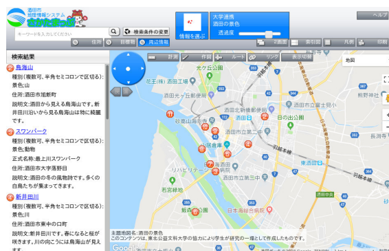
図 1.1: マップの例

近年 Google マイマップ [1] や uMap[2] 等で Web 上で独自にマップを作成するものがあり各種用途に利用されている。例の一つとして観光マップがある。観光マップでは、地元の人、県外の人、外国の人などの立場によって求める内容が異なる。これまでは、地図を作る人の立場のみ考えられており、マップの閲覧者の立場が考えられていない。そこでマップに閲覧者の視点を導入したシステムを提案する。マップは、アイコンやラインなどのオブジェクトがあるものとする (図 1.1)。